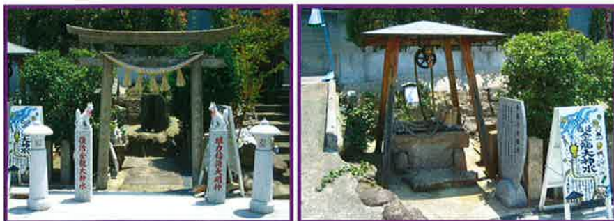
正一位眼力稻荷大明神