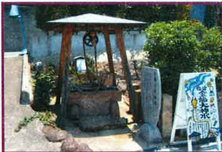
正一位眼力稲荷大明神