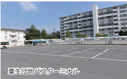
粟生団地バスターミナル

彩都西駅ロータリー墓参バス乗り場 彩都西駅ロータリー阪急バス乗り場③付近に停まります